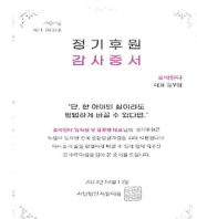
愛つなぎ後援証書